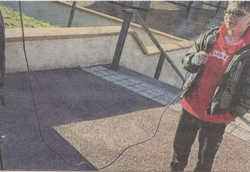
t prêtés au jeu.

rs sont souvent des joies de la de montagne es et ceux qui gés scolaires res de la MJC raient réservé que et créati- la municipali- AF54, du con- e Meurthe-et- on Grand Est, ionné leur ta- ssant derriè- a première se-