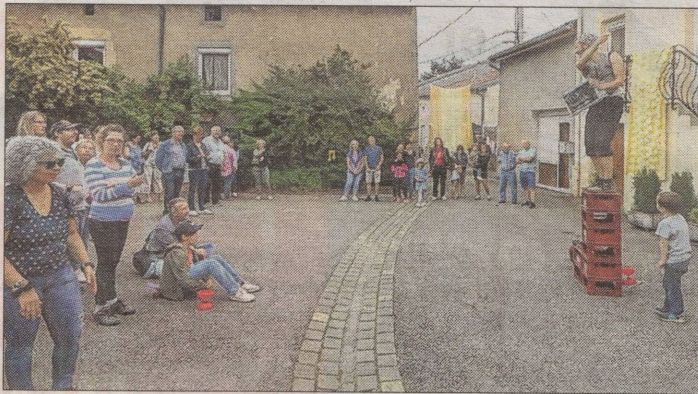
Le festival Graine d'arts pourrait être organisé le 25 juin.

Réuni le soir du 3 février à la mairie, le conseil municipal a commencé sa session en acceptant, à l'unanimité, la location d'un terrain communal de 42 ares, lieu-dit Ruby Plantois, à une particulière souhaitant y installer ses moutons. Le bail agricole sera d'une durée de neuf ans et d'un montant de 60 € par an, revalorisé chaque année à la date anniversaire selon l'indice de fermage en vigueur.